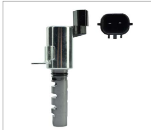
190-050 LADO ADMISIÓN