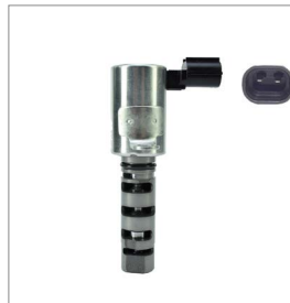
190-053 LADO ESCAPE